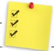
TABLEAU SYNTHÈSE FRAIS DU SERVICE DE GARDE

Un enfant peut se voir retirer le droit de fréquenter temporairement le service de garde ou en être exclu pour toute raison jugée valable par la direction comme le non-paiement par les parents des services facturés, le comportement inadéquat de l'enfant, des gestes de violence reconnus ou autres motifs